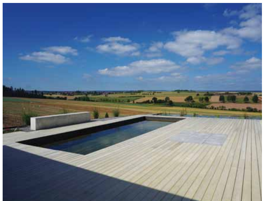
▲ Musteranlage der Firma Grünraumplanung