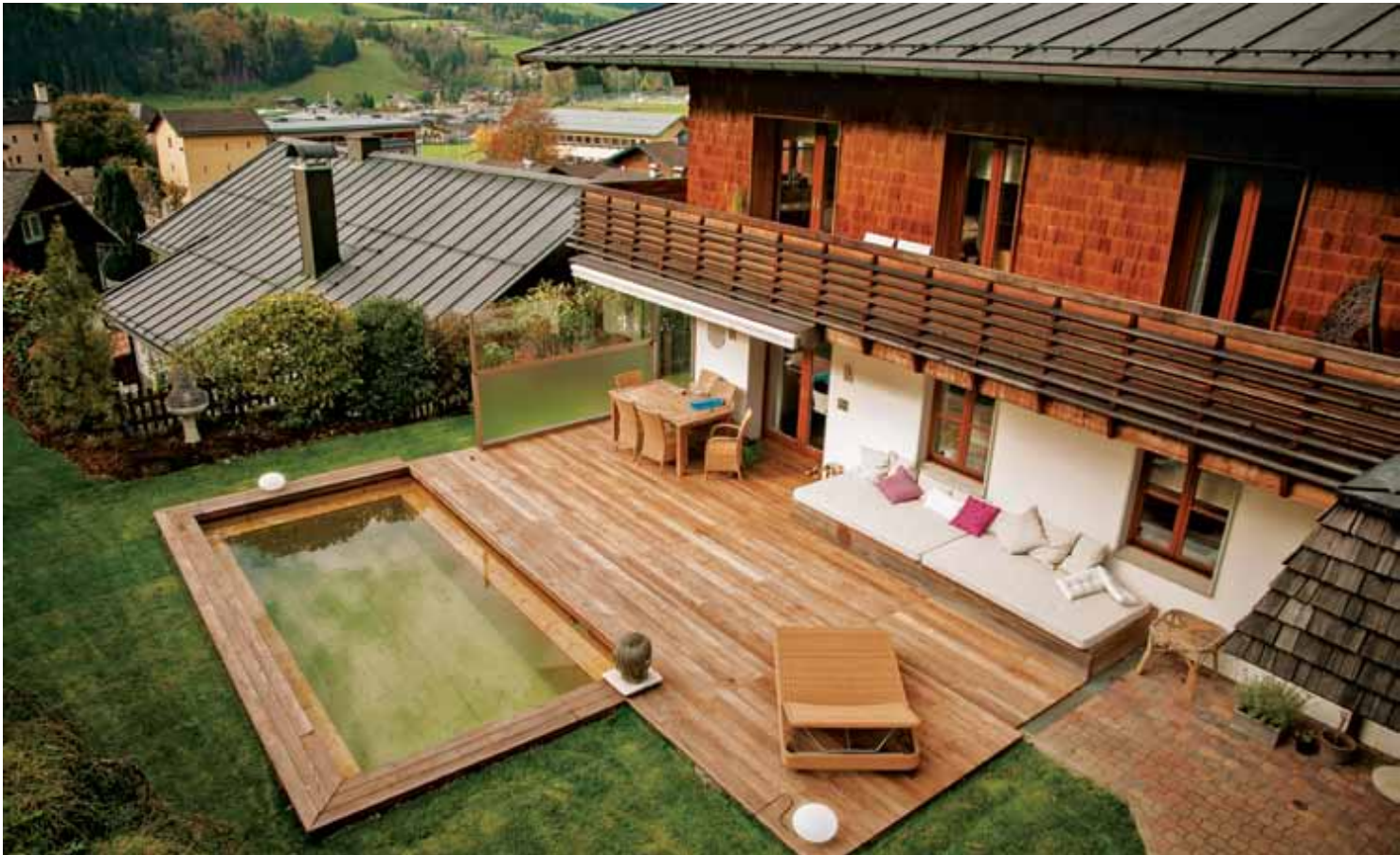
▲ Der Naturbaustoff Holz ist für eine sehr lange Haltbarkeit geschaffen und zeichnet sich durch eine attraktive und angenehme Oberfläche aus. Holz ist ein »gesunder« Baustoff und somit optimal, um eine Badeoase für die ganze Familie kostengünstig zu realisieren.