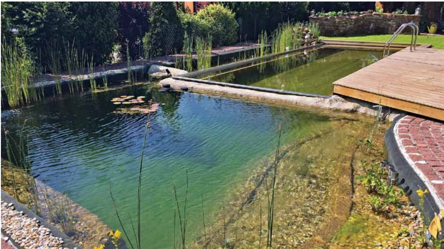
▲ Trotz eines hohen Vorfertigungsgrades ist der Individualität keine Grenze gesetzt. Jedoch setzt immer das Holz den »organischen Akzent« und steht wie kaum ein anderer Baustoff für Nachhaltigkeit und Naturnähe.